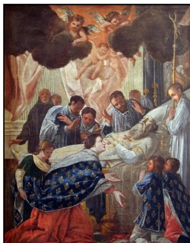
Meaux : St-Éloi,