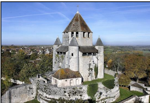
Provins : la tour César