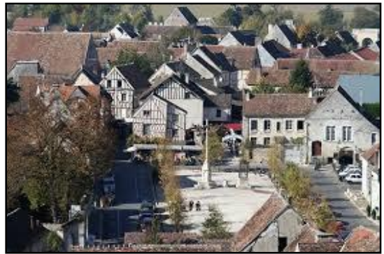
Provins : la place du Châtel