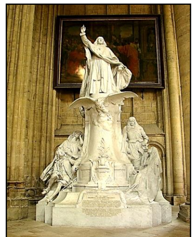
Meaux : le monument Bossuet.