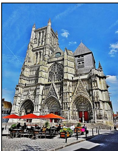
Meaux : la cathédrale St-Étienne,