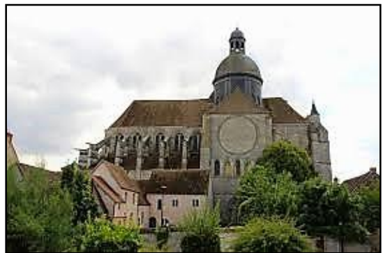
Provins : la collégiale St-Quiriace