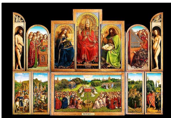
GAND : Le retable « l'agneau mystique ».