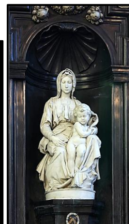
BRUGES : « La Vierge et l'Enfant ».