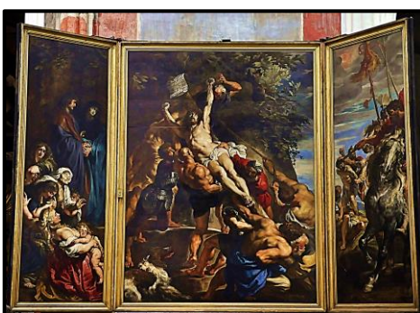
ANVERS : Le triptyque de Rubens.