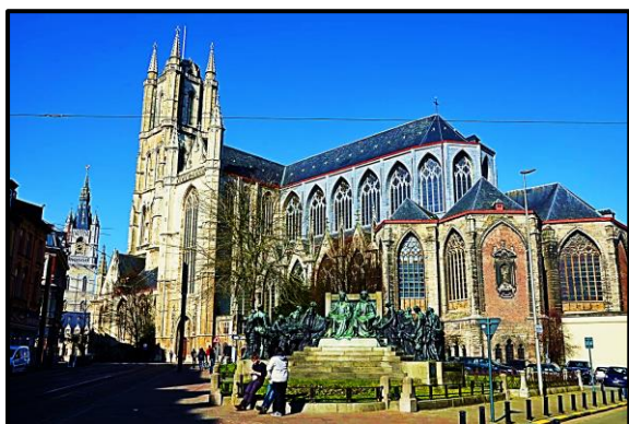
GAND : La cathédrale et le monument des frères Van Eyck.

(Voir au verso le programme détaillé de ce voyage, et le bulletin d'inscription).