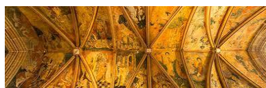
Eglise de Kernascléden