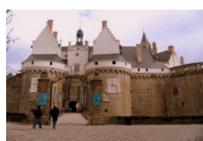
Château « Anne de Bretagne »