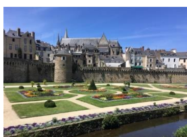
Remparts de Vannes