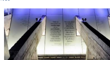
Musée de l'Esclavage