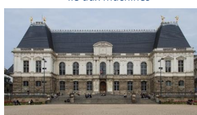
Parlement de Bretagne