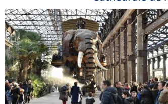
Île aux machines