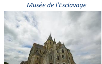
Abbaye de Saint Vigor