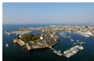
Concarneau ville close