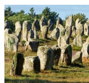
Alignements des menhirs