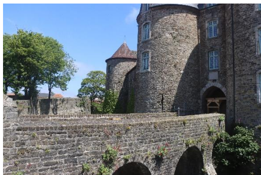
Château de Boulogne sur Mer