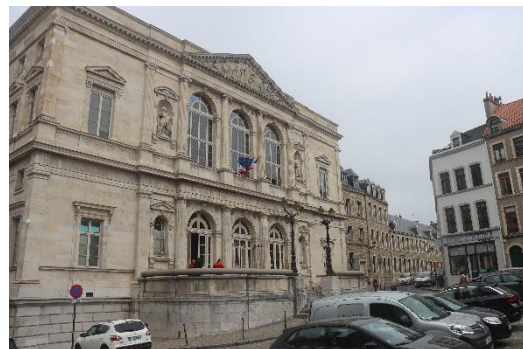
Palais de Justice