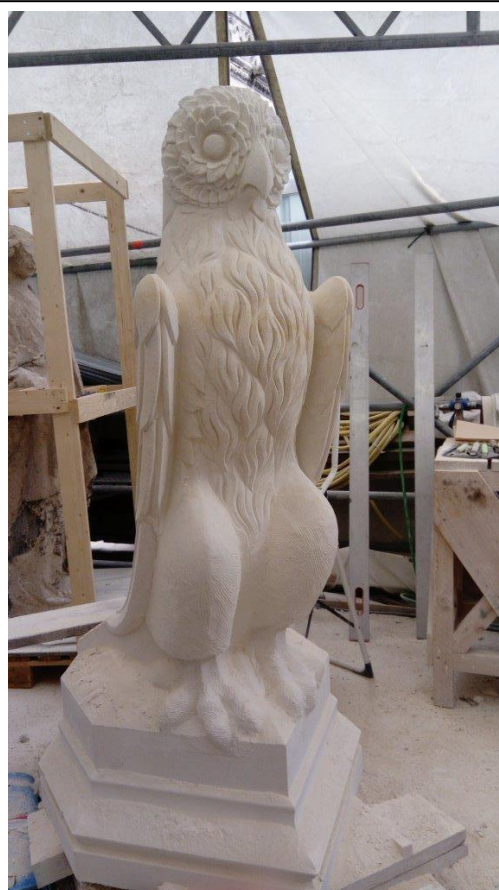
Figure 2 : Façade sud, chouette : copie exécutée en taille directe par M. Fabre, de l'atelier Degaine.