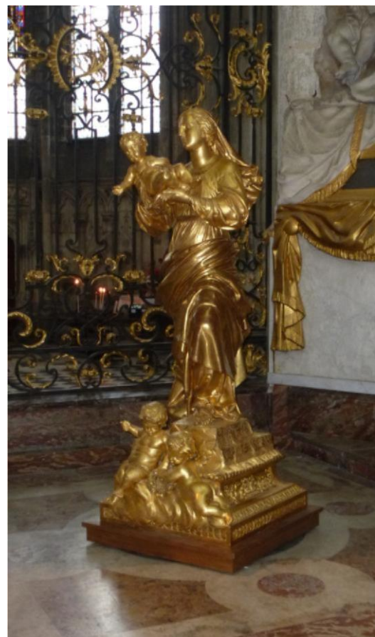
Figure 6 : Groupe sculpté de la Vierge à l'Enfant, dite La Mondaine : retour dans le sanctuaire de la cathédrale le 6 décembre 2017, à l'issue de sa restauration.