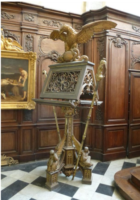
Figure 5 : Aigle-lutrin.