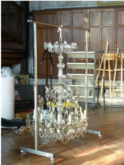
Figure 3 : Lustre de la chapelle d'hiver prêt à partir en restauration dans l'atelier Chant-Viron.