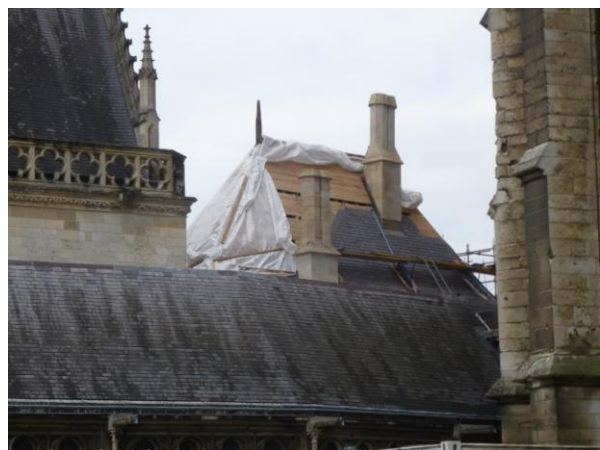
Figure 4 : « Maison du sacristain » : toiture en cours de réfection par l'entreprise Battais.