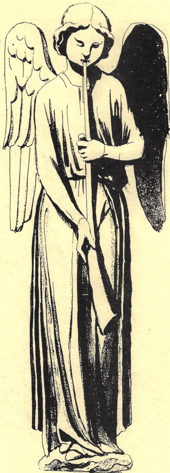
ANGE AU SOMMET DU GABLE DE LA PORTE CENTRALE mars 1861