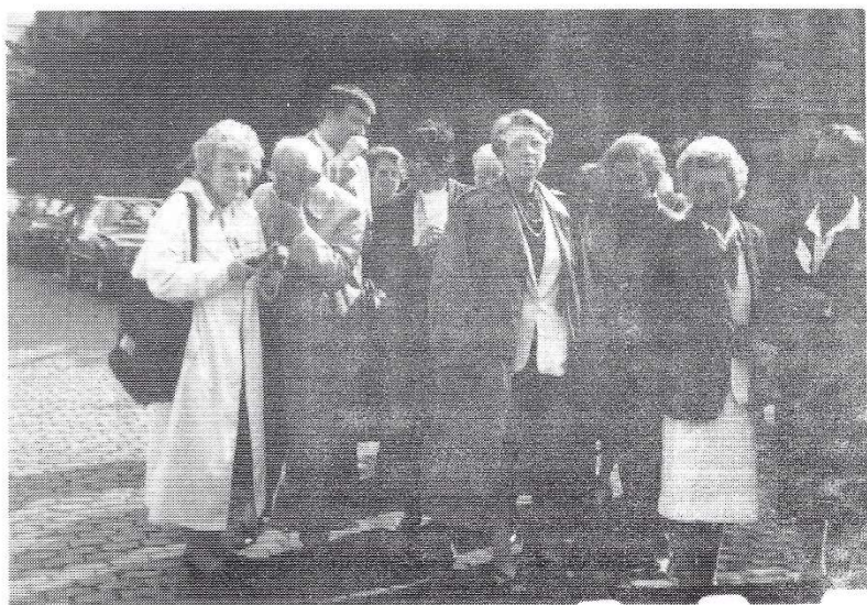
Une autre partie du groupe.