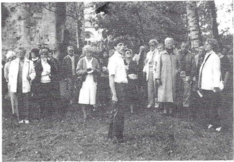
OURSCAMPS - Le groupe au milieu des ruines de l'abbaye.