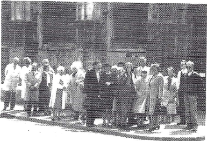
RUE - Le groupe devant l'église du Saint-Esprit.